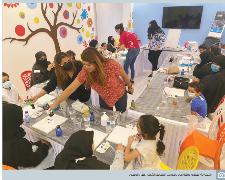
بإسبانية، وتنظم ورشة عمل للتدريب أطفالها الأطفال على الرسم.

مسكين الأمير تميم كلما حاول أن يثبت أنه نحي والده والأخير له المكانة الاجتماعية فقط ولا قرار سياسياً في يده، ظهر الأب ليعلم كل ما يراه الابن من جديد ويعيد قطر لنقطة المشرق عربياً، خلاصة القول لا فائدة وأمل ولا رجا، ينظر من قطر مزال هذا الشخص موجوداً.