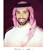
عبدالله بن خليفة