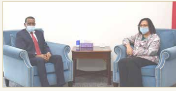
المنامة - وزارة الصحة

استقبلت وزيرة الصحة فائقة الصالح بمتكبتها بايديان الوزارة في أبراج الخبر بمنطقة السداس القنصل العام لجمهورية إثيوبيا الفيدرالية الديمقراطية لدى مملكة البحرين جمال بكر عبدالله. وفي مستهل اللقاء، رحبت الوزيرة بالقنصل وأشادت بعلاقات الصداقة التي تجمع بين مملكة البحرين وجمهورية إثيوبيا في مختلف المجالات. العلاقات الثنائية التي تربط بين البلدين الصديقين، مشيداً بالجهود والإنجازات الكبيرة التي قدمتها مملكة البحرين في التصدي لجائحة كورونا (كوفيد